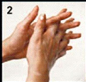
2 Between fingers उंगलियों के बीच में