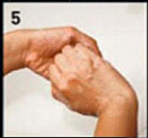
5 Back of fingers उंगलियों के पिछले हिस्से