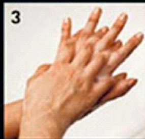
3 Back of hands हाथों के बाहरी हिस्से