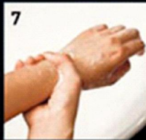
7 Wrists कलाईयाँ धोना