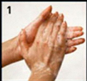
1 Palm to palm हथेलियों से हथेलियाँ मल कर