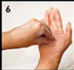
6 Fingernails उंगलियों के नाखून