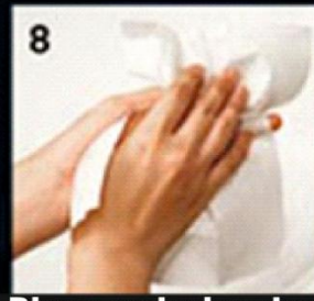
8 Rinse and wipe dry पानी उतारे और पोंछें

The simple act of washing hands with soap can reduce water borne diseases by 70%.