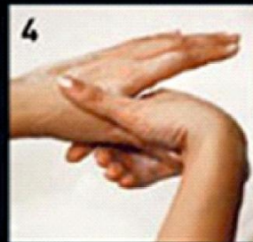
4 Base of thumbs उंगलियों के निचले हिस्से